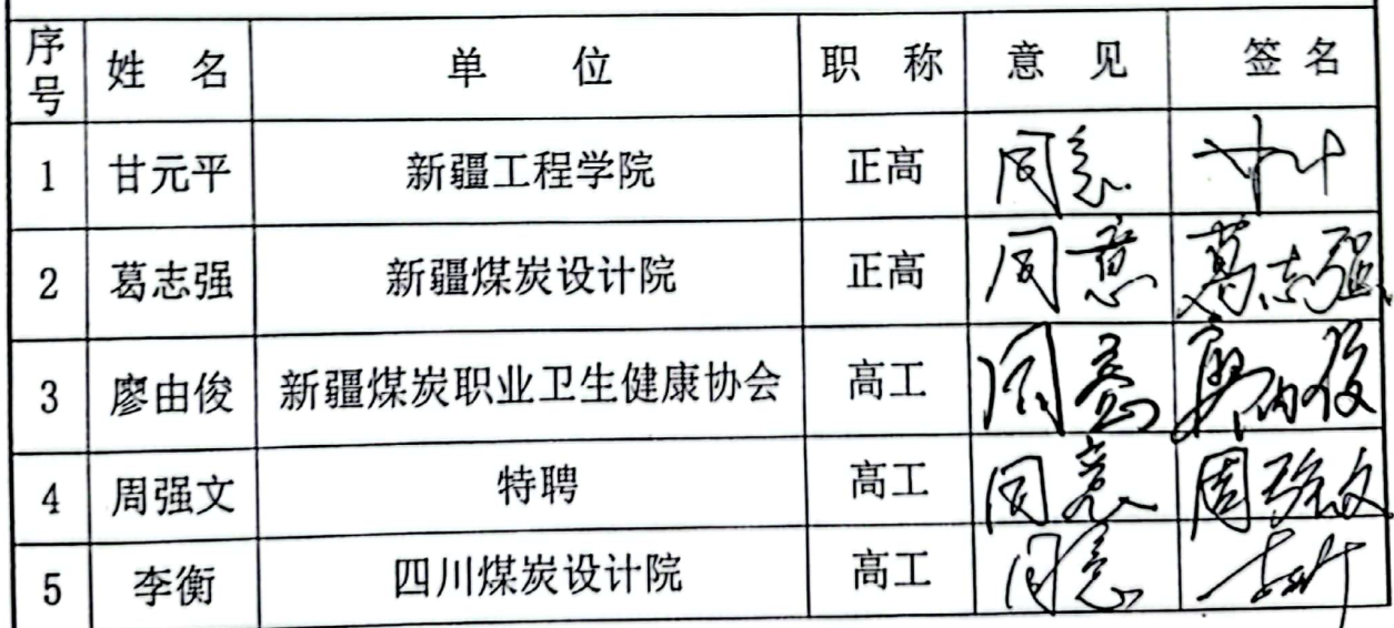
评审专家组成员表